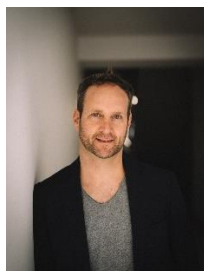
Dr. Matthias Strolz Beirat der MEGA Bildungsstiftung